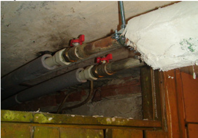
17 pav. KV vamzdynai rūsyje