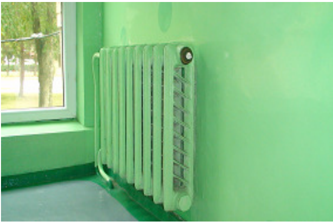
13 pav. Radiatorius laiptinėje