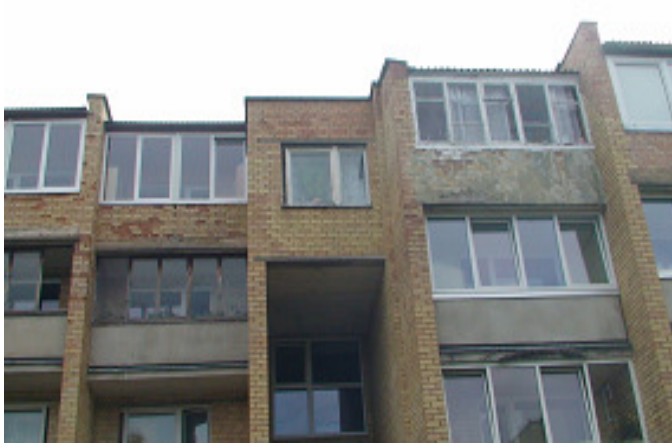
7 pav. Buto langas