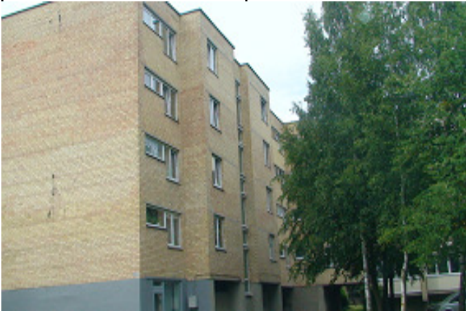
1 pav. Šiaurės rytų fasadas