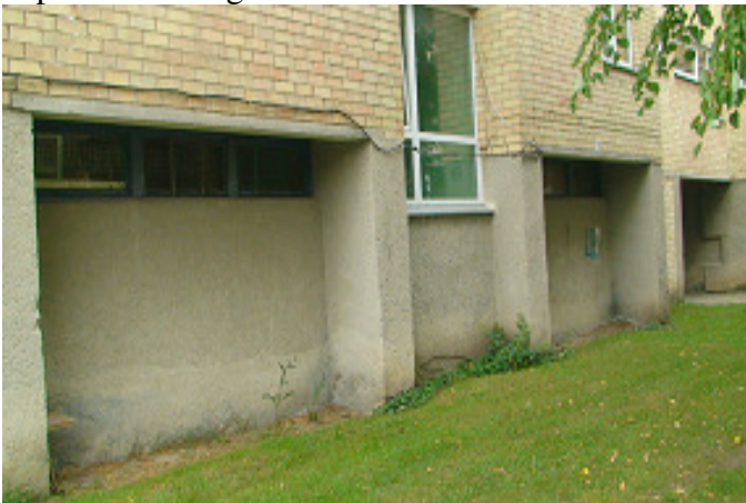
9 pav. Cokolis ir rūšio langas