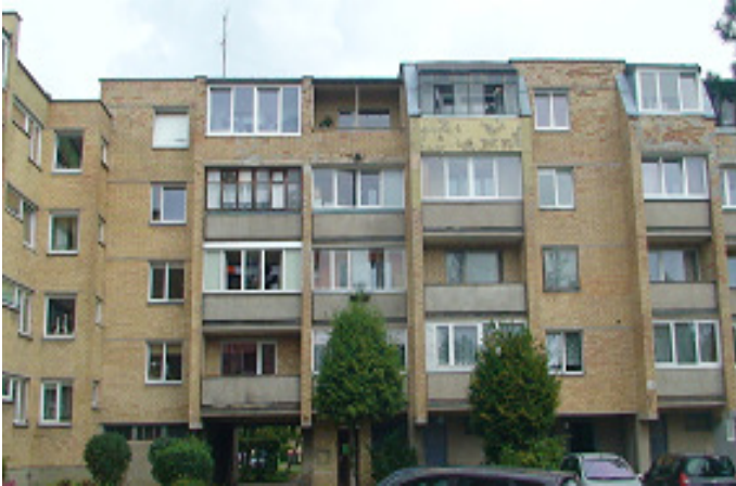
3 pav. Pietvakarių fasadas