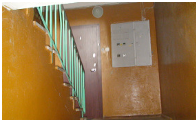
20 pav. Laiptinė