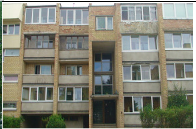
2 pav. Šiaurės vakarų fasadas