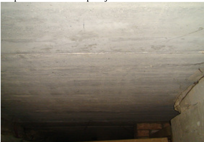
15 pav. Rūsio lubos