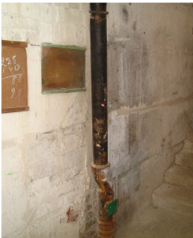
19 pav. Nuotėkų stovas