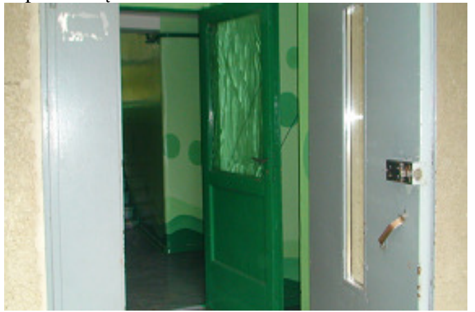
10 pav. Tamburo durys