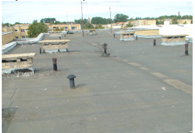
12 pav. Stogas