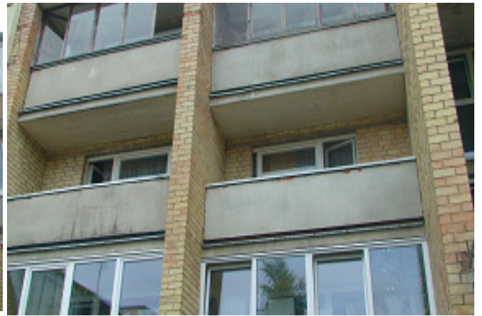
8 pav. Butų balkonai