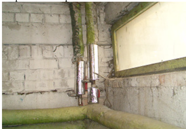
16 pav. Šildymo sistemos vamzdžiai