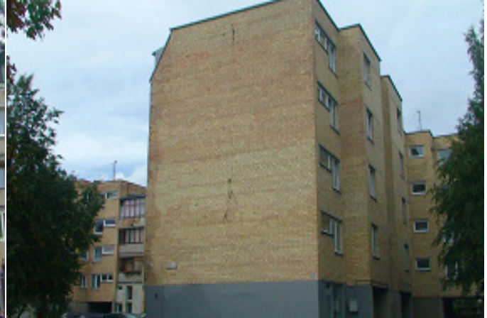
4 pav. Pietryčių fasadas