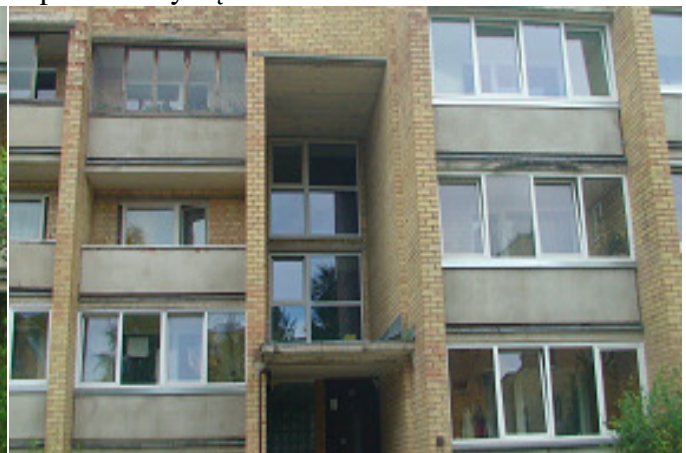
6 pav. Laiptinės langai