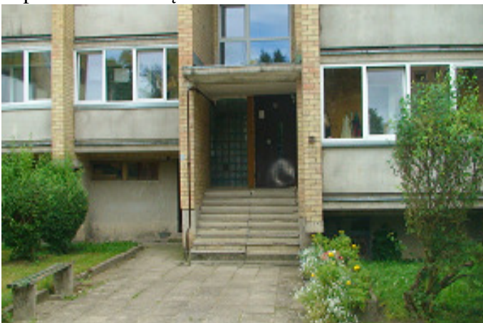
5 pav. Laiptinės lauko durys