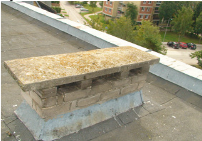
11 pav. Ventiliacijos kaminėlis