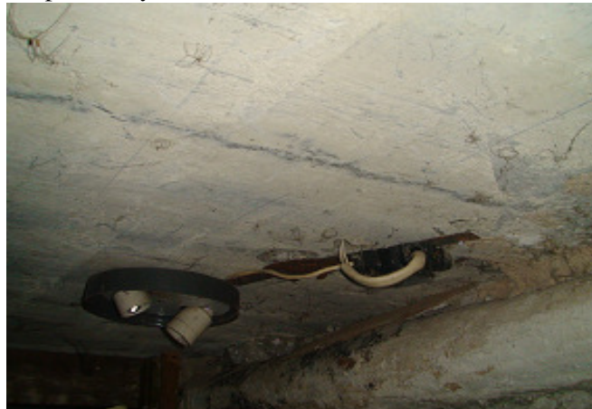
18 pav. El. instaliacija rūsyje