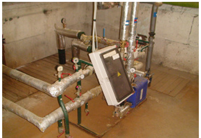
14 pav. Šilumos punktas